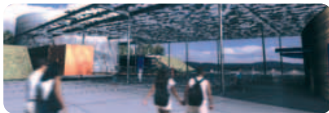
Entrée du Bioscope à Ungersheim (Haut-Rhin).

Au premier trimestre, le chiffre d'affaires a augmenté de 12,6 % à périmètre réel et de 8,9 % à périmètre comparable, notamment grâce à une saison prolongée jusqu'à la fin du mois d'octobre au Parc Astérix et à la poursuite des effets bénéfiques en fin de saison d'été de la rénovation du Dolfinarium des Pays-Bas.