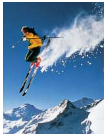
Actus Finance & Communication